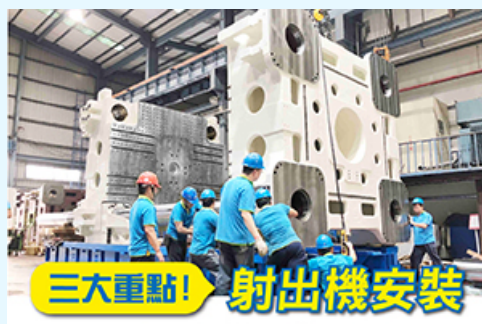
三大重點! 射出機安裝